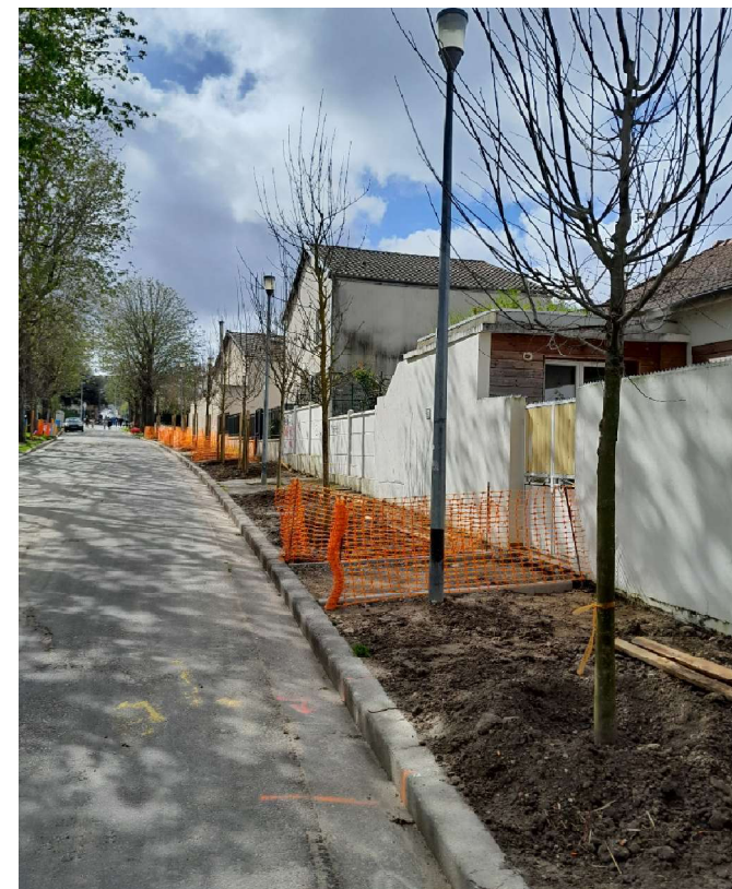
Allée des marronniers: remplacement de 27 arbres et végétalisation du trottoir