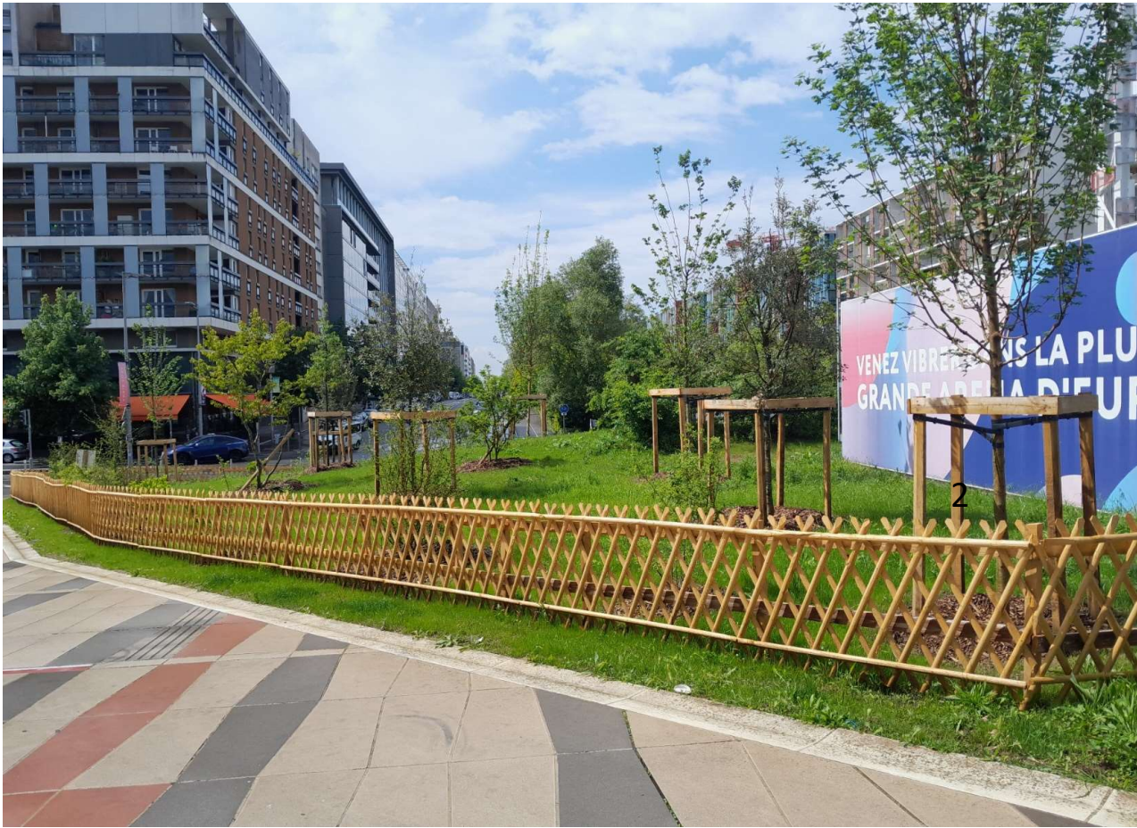
Le bosquet de l'ARENA en mai 2024