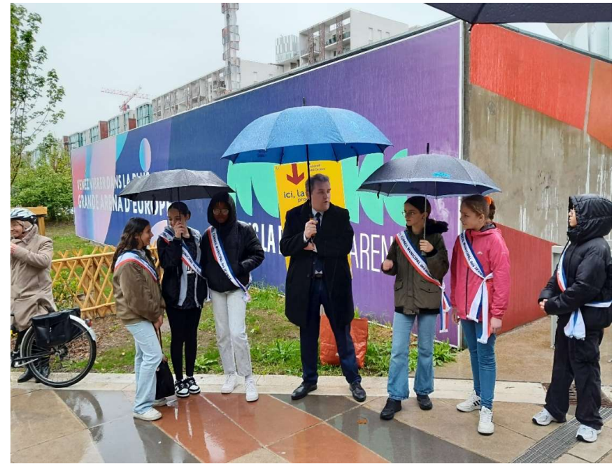
L'inauguration avec les enfants du conseil municipal des jeunes